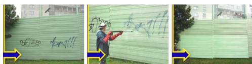
Chemiczne usuwanie graffiti z metalowych ekranów akustycznych, przy użyciu środków AGS 221, AGS 5